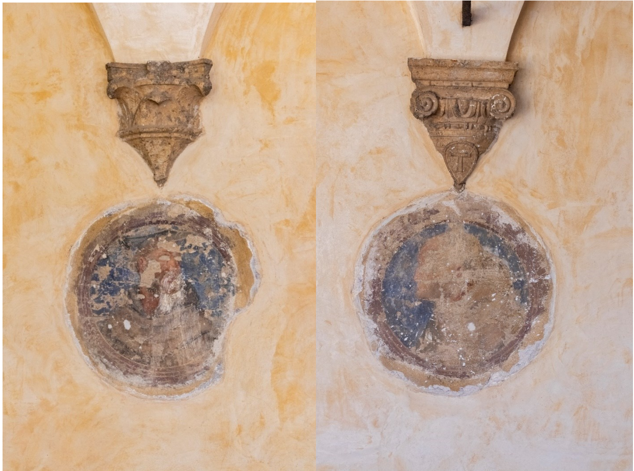
Fig. 11 e 12 Medaglioni, ritratti di frati

FONDAZIONE PER LA BASILICA DI SAN FRANCESCO IN ASSISI SECURITAS PAX SANITAS AMBIENS