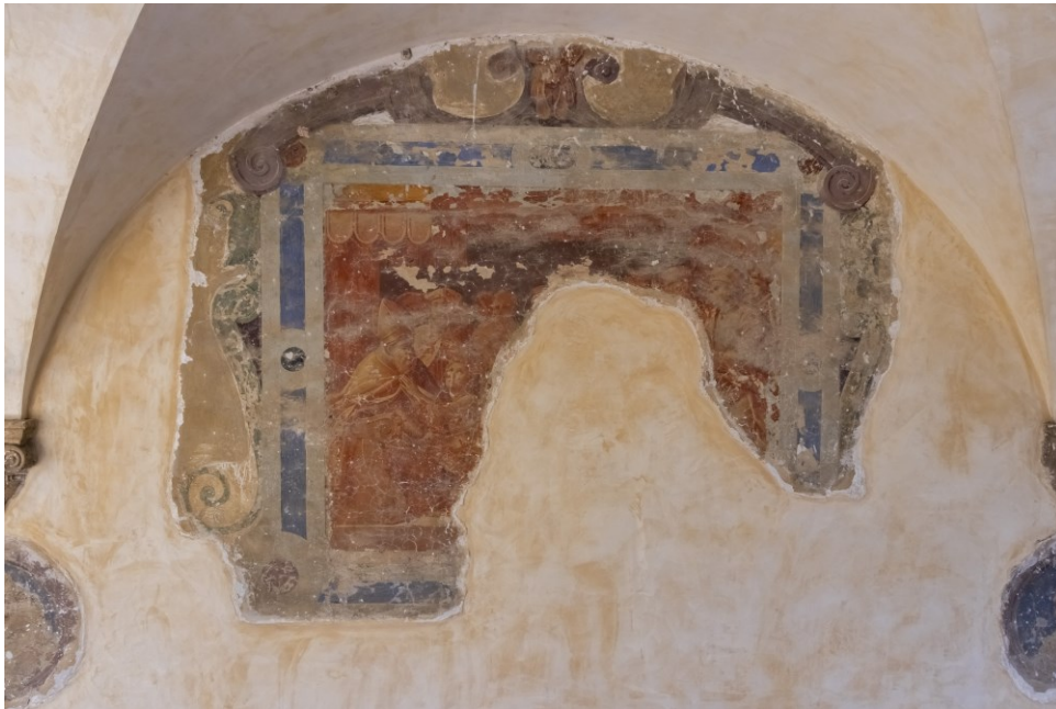
Fig. 6 Storie della vita e dei miracoli di S. Francesco