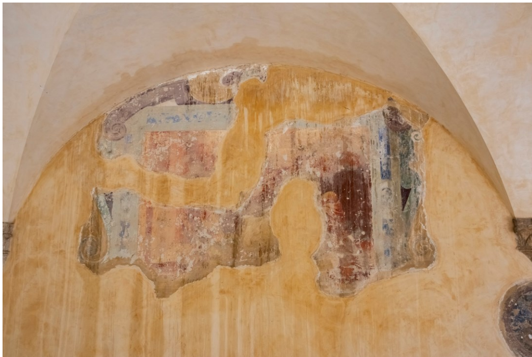
Fig. 4 Storie della vita e dei miracoli di S. Francesco