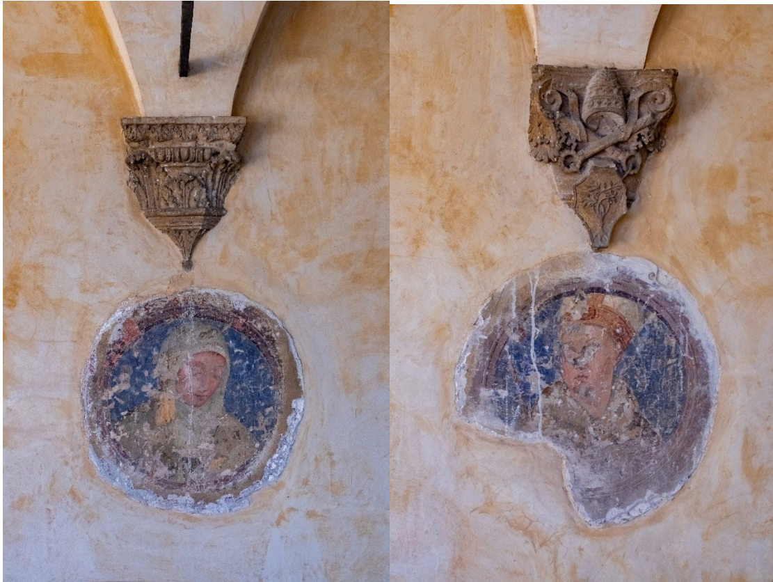
Fig. 15 e 16 Medaglioni, ritratti

FONDAZIONE PER LA BASILICA DI SAN FRANCESCO IN ASSISI SECURITAS PAX SANITAS AMBIENS