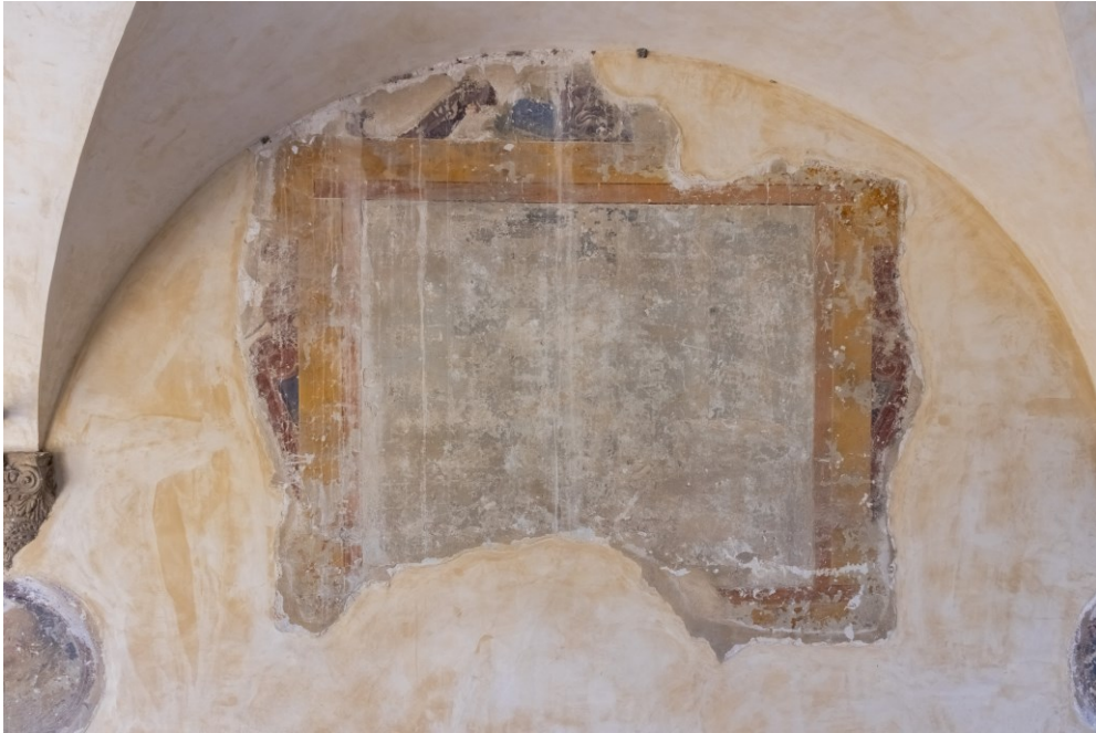
Fig. 9 Storie della vita e dei miracoli di S. Francesco

FONDAZIONE PER LA BASILICA DI SAN FRANCESCO IN ASSISI SECURITAS PAX SANITAS AMBIENS