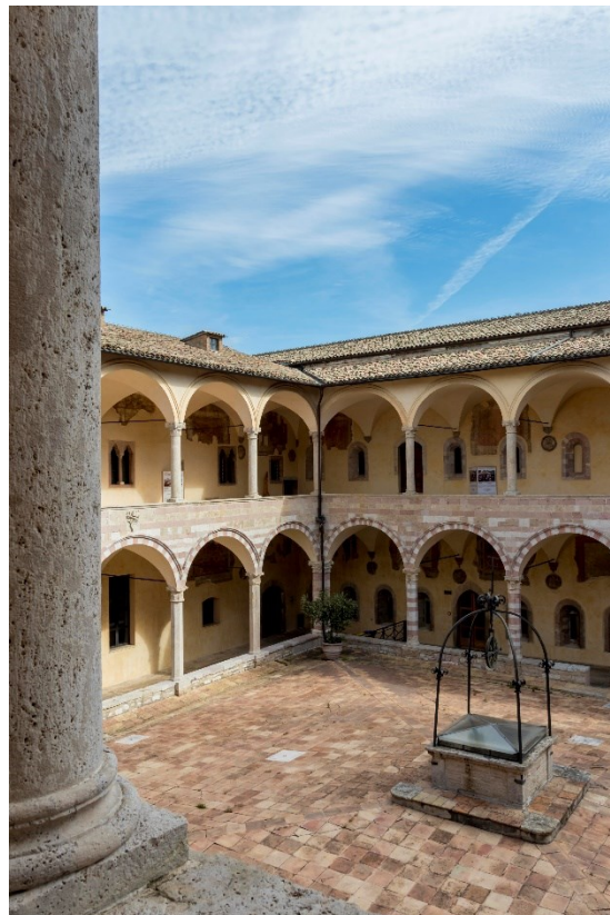
Figg. 2-3 Foto generali del chiostro