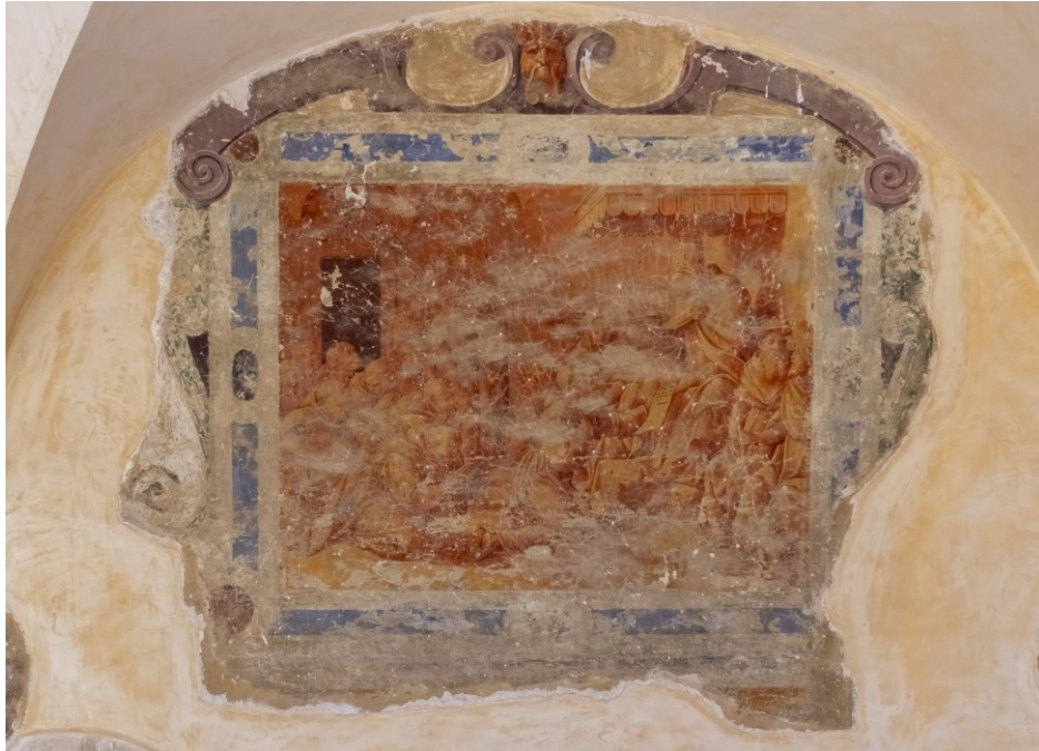
Fig. 5 Storie della vita e dei miracoli di S. Francesco

FONDAZIONE PER LA BASILICA DI SAN FRANCESCO IN ASSISI SECURITAS PAX SANITAS AMBIENS