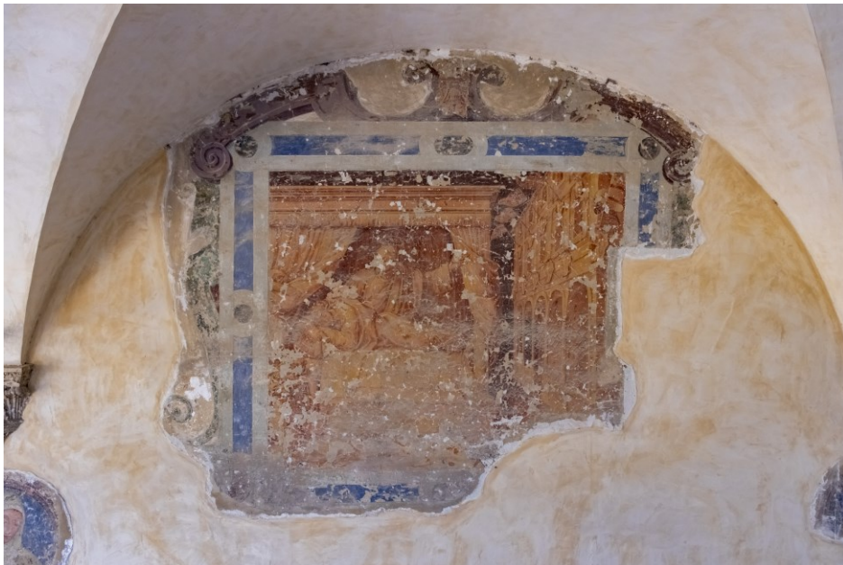
Fig. 8 Storie della vita e dei miracoli di S. Francesco