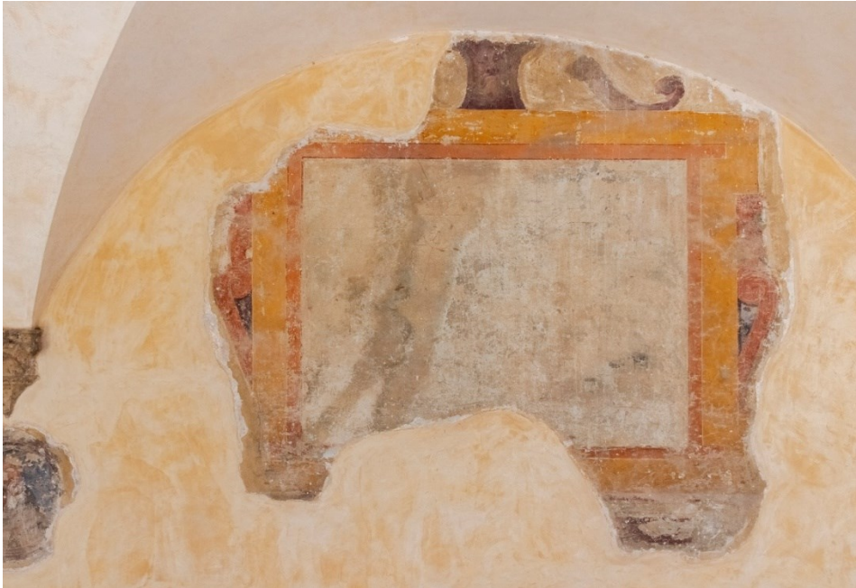
Fig. 7 Storie della vita e dei miracoli di S. Francesco

FONDAZIONE PER LA BASILICA DI SAN FRANCESCO IN ASSISI SECURITAS PAX SANITAS AMBIENS