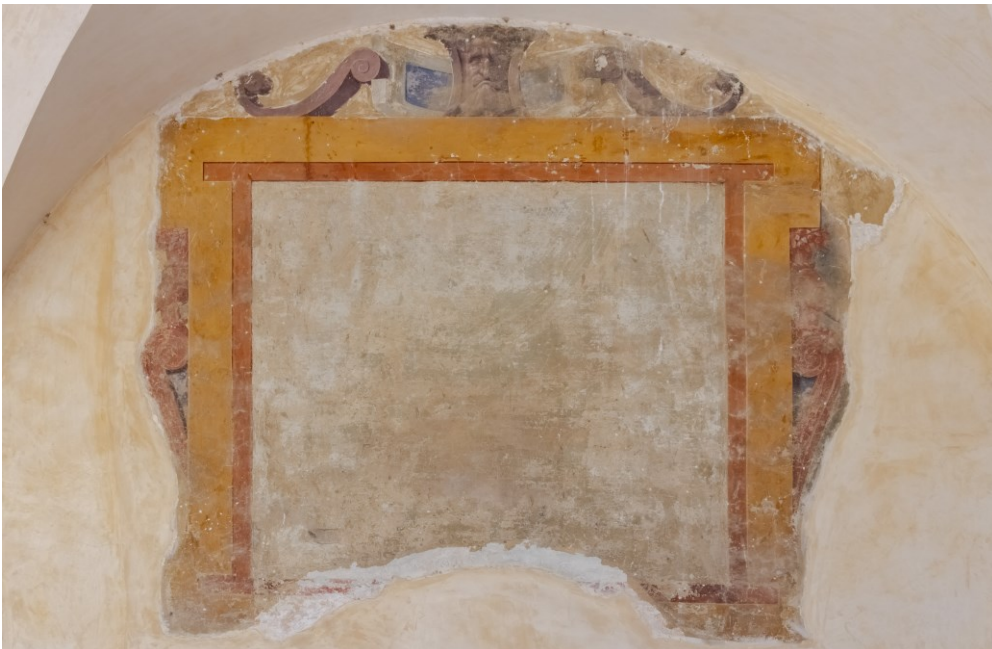
Fig. 10 Storie della vita e dei miracoli di S. Francesco