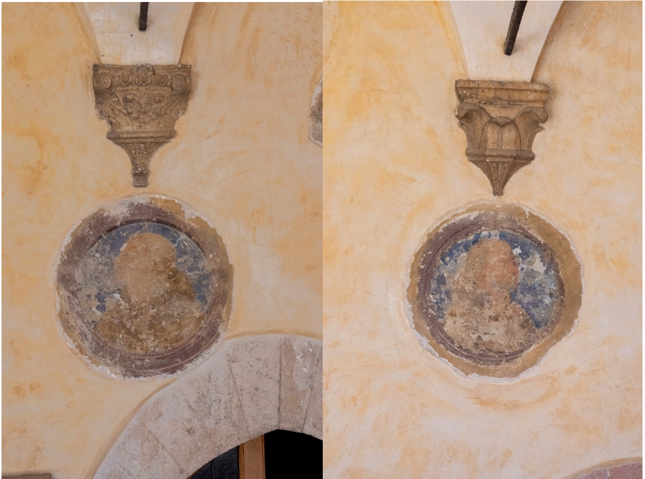
Fig. 13 e 14 Medaglioni, ritratti di frati

FONDAZIONE PER LA BASILICA DI SAN FRANCESCO IN ASSISI SECURITAS PAX SANITAS AMBIENS